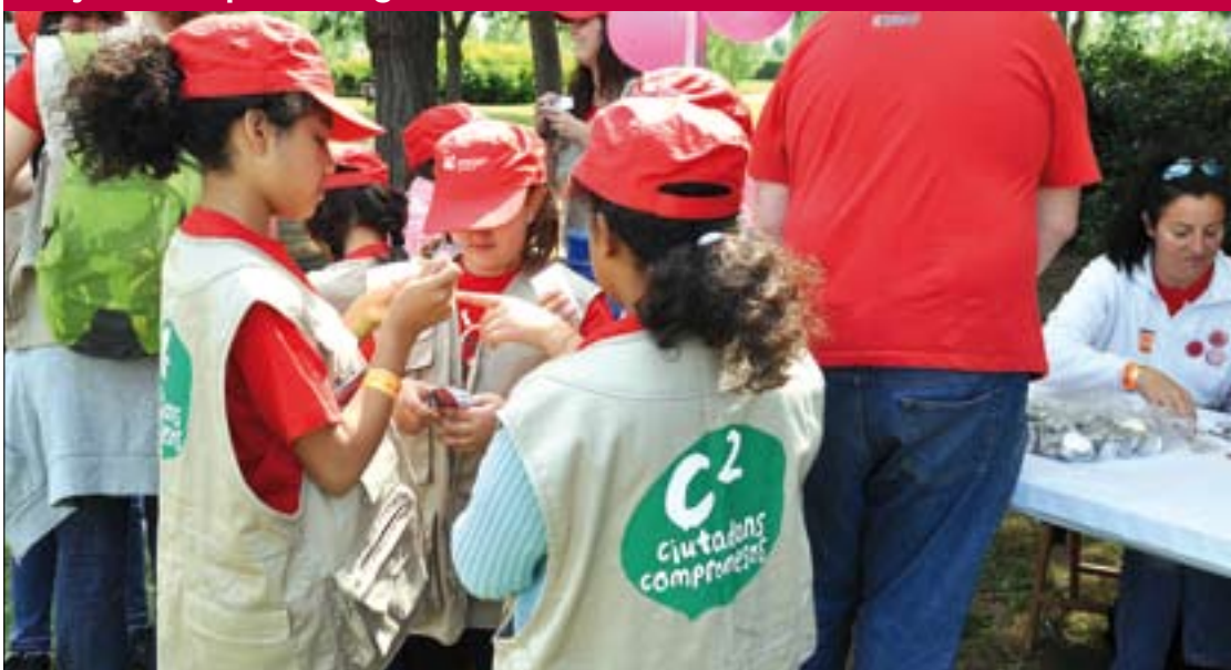
Els infants que participen aprenen a responsabilitzar-se