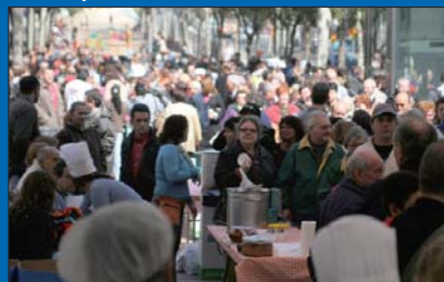
Festival de sopes del món mundial 2008