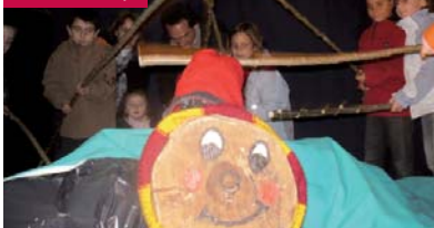
Sant Joan Despi

L'esplai Eixida-Camps Blancs va anar d'excursió a Collserola a gaudir de la Natura, durant el darrer trimestre. Allà, petits i mitjans han fet d'exploradors amb el seu llibre de natura i passat diferents proves per tot el camí fins a la font de la Budellera. Els grans i els joves van fer un joc de rol sobre la història de Verdaguer .