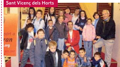
Sant Vicenç dels Horts

Cada any, l'esplai La Fàbrica-Can Tusell va a la neu, amb famílies. Enguany va ser el 15 de febrer, quan van marxar a la Molina, amb 75 persones, amb la samarreta de l'esplai. Després, concurs de trineus i de ninots de neu. Després de xalar durant el matí, van fer el dinar comunal i el cafetó.