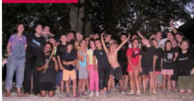
Castellar del Vallès

El 7 i 8 de febrer el C.A.E. La Llar del Vent va realitzar l'excursió de cap de setmana del 2n trimestre. Tot l'esplai es va desplaçar fins a la casa de colònies Josep Masclans, molt prop de la població de Capellades. La proposta de la jornada va consistir en fer d'exploradors per intentar trobar lúdrigues al riu Anoia.