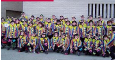
Sant Feliu de Llobregat