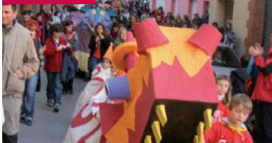
La Riera de Gaia

L'esplai Sargantana va organitzar uns campaments de Setmana Santa per a petits, mitjans i joves a Caldes , al terreny d'acampada d'El Pasqualet. Els que hi van anar, a més de viure al camp hi van descobrir els éssers fantàstics que viuen al bosc i les possibilitats de guanyar-se la vida treballant un hort.