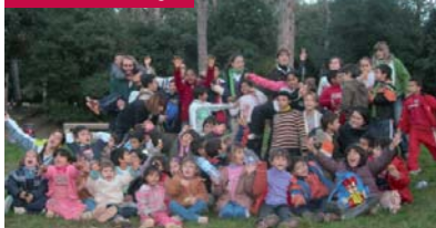
Sant Boi de Llobregat

L'entitat en el lleure Punt Sud demana la col·laboració de les persones que tenen compte a la Caixa Tarragona, que votin per la continuïtat del seu projecte de ludoteca itinerant que han presentat al programa TU AJUDES de l'obra social d'aquesta Caixa. El codi és el 259 i els infants de la Terra Alta us ho agrairan!